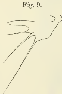
Fig. 7. P. brevipes . 3. Fuß. 520 \times . Fig. 8. P. brevipes . 4. Fuß. 520 \times . Fig. 9. P. brevipes . 5. Fuß. 700 \times .

4. Fußpaar: Der Außenast ist aus drei, ziemlich gleichlangen Gliedern zusammengesetzt. Das erste Segment ist wie das entsprechende des 2. und 3. Fuß-